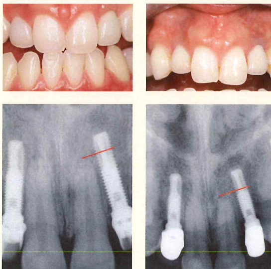
図4 -a~d(a, b): 1993年と2008年の口腔内写真における、天然の中切歯に隣接する側切歯部の切端と歯肉と歯冠の境界部の変化を示している。(c, d): 1993年と2010年のX線写真は17年間の直径3mm、長径13mmのインプラント体の経過を示している。左側側切歯部のインプラント体が、インプラント体のスレッドがシャープに撮影されている状態からX線ビームが垂直に当たっていることが分かる。中切歯の根尖部の位置が、側切歯部のインプラント体先端部の切り取られている部位の中間に位置していることが分かる(c)。それに対して(d)のX線写真においては中切歯の根尖は側切歯部のインプラント体先端部の切り取られている部分の上の部分になって、下方に移動している。インプラント体と鼻腔底との位置関係には変化が見られない。